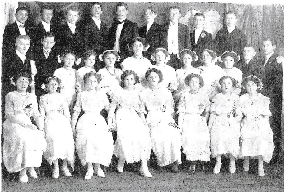
VERGILBT, ABER UNVERGESSEN

Ich will Ihnen aber etwas mitteilen, was Ihnen sonst niemand sagt oder sagen kann. „Was ist denn eigentlich zu tun, damit es endlich anders wird“, hört man immer wieder fragen. Was dazu allerhand geantwortet wird, geht meistens an ganz Wesentlichem vorbei. Man kann sich in einem solchen totalitären System nicht plötzlich auf den Kopf stellen – das gilt für den Arbeiter im Betrieb, den Bauern in der LPG (Kolchose) und alle. Die meisten müssen ja auch Rücksicht auf ihre Familien nehmen. Ein gewaltsamer Aufstand kommt also heute nicht in Betracht. Wenn in der Zone heute der Einzelne der rücksichtslosen Unterdrückung der menschlichen Persönlichkeit und seiner Würde ausgesetzt ist (bei einer Reise nach Westdeutschland muß man z. B. detailliert angeben, welche Geschenke man mitnimmt und welche man von den westdeutschen Verwandten bekommt! etc. etc.), dann kann er nur das eine tun, wenigstens selbst seine Ehre und Würde als Persönlichkeit zu wahren und sich nicht zu einer Null zu degradieren. Die führende SED-