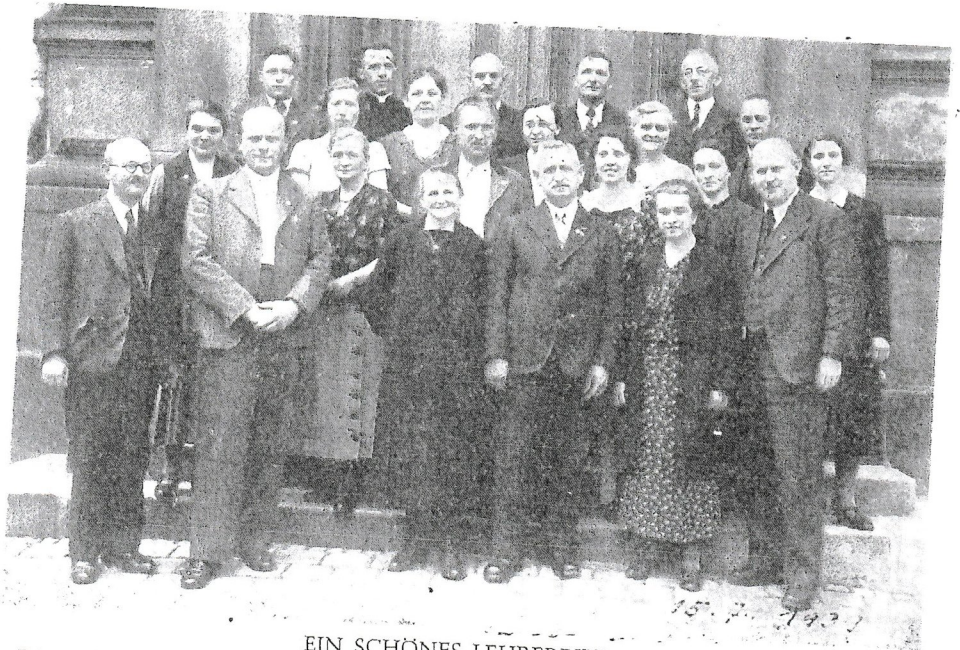
EIN SCHÖNES LEHRERBILD