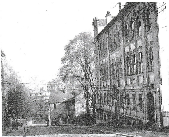
Gewerbeschule, Aufnahme von heute