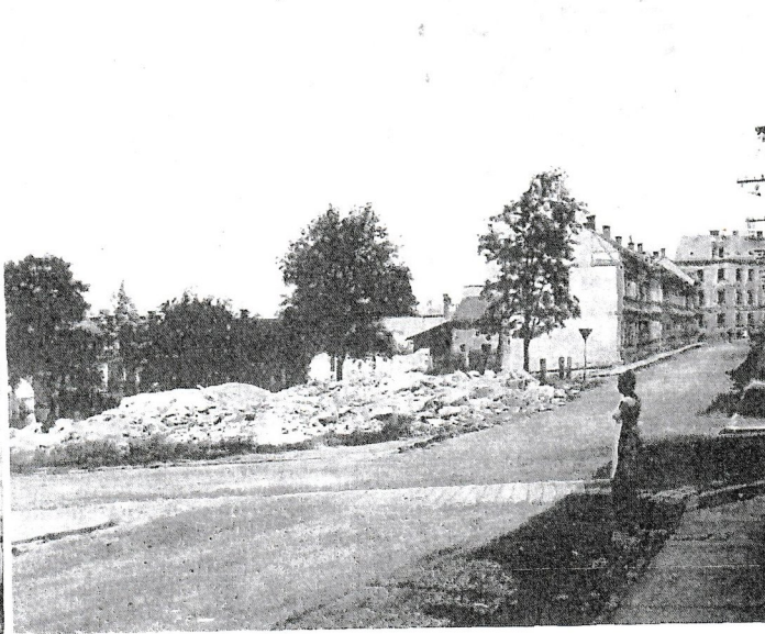
Die Reste des „Alten Armenhauses“, Schillergasse

Umschichtung in den Führungskadern der Wirtschaft und eine weitere Konzentration in der Verwaltung gleichgelagerter industrieller Betriebe.